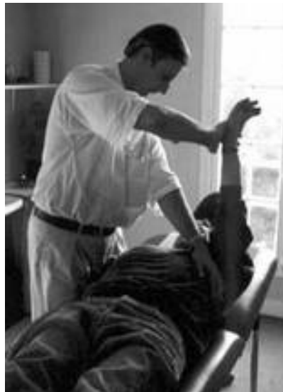
Variante allongée, Crédit Askinésio