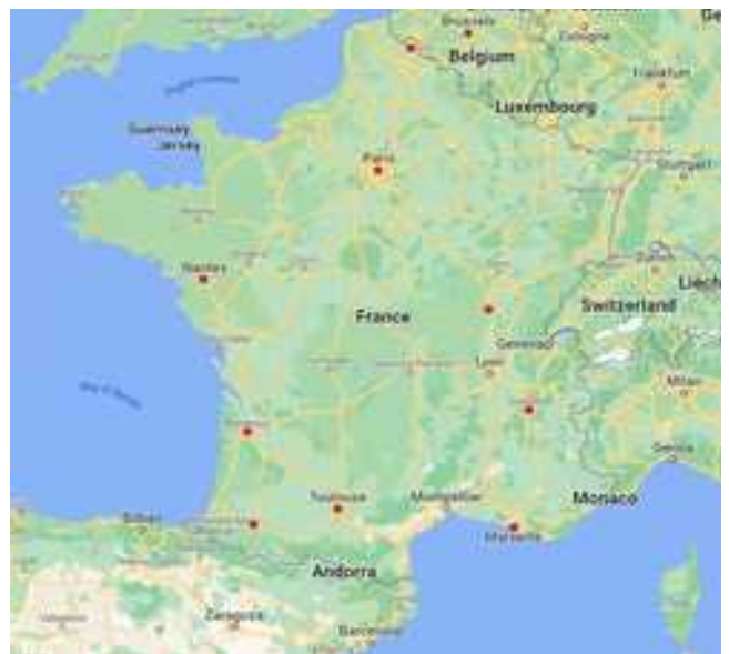
IMAGE 1 Répartition des témoignages (points rouges) sur la France métropolitaine, certains témoignages viennent de la même ville, notamment Paris, Toulouse et Grenoble; Source: Google Maps